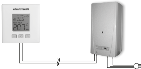
МАЛЮНОК 1. (ст4)

Термостат типу COMPUTHERM Q32 підходить для регулювання більшості котлів та кондиціонерів. Його можна легко підключити до будь-якого газового котла з двопровідною точкою підключення для кімнатного термостата, а також до будь-якого кондиціонера або іншого електричного пристрою, незалежно від того, чи мають вони 24 В або 230 В керуючу схему.